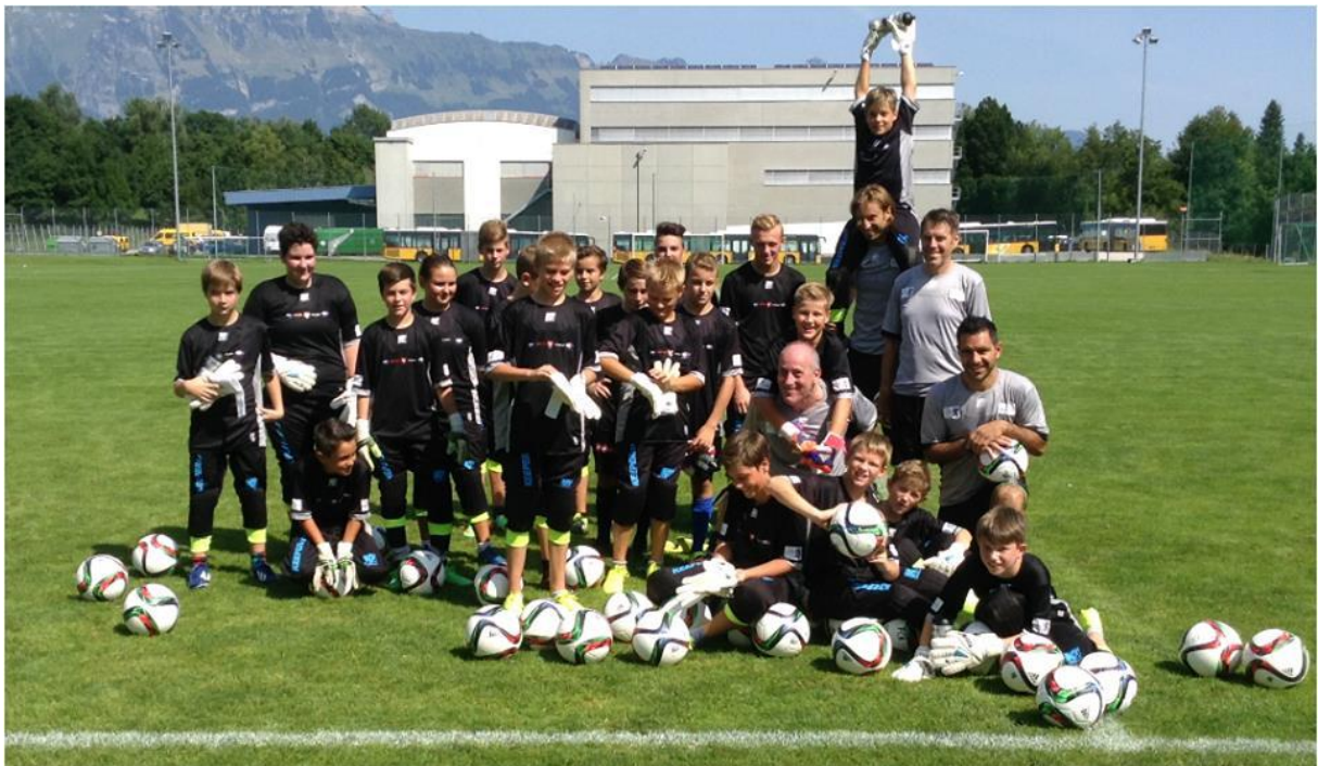
Gruppenfoto einmal anders! Sogar der Eiffelturm war zu Gast bei unserem Camp!